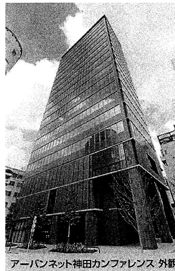
アーバンネット神田カンファレンス 外観